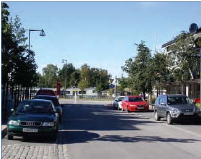
Eksempel på gateparkering på Arnes

Av planene for utforming av fylkesveien fremgår det at fylkesveien planlegges nært Hjørnegården som medfører at det må opparbeides et smalt og farlig fortau langs bygget. Vi registrerer at det er rikelig med plass på motsatt side av vegen og at vegen dermed kan forskyves mot øst. Dette vil også gi plass til flere plasser med kantparkering langs begge sider av fylkesveien, se figur 1 og 2 nedenfor som eksempel.