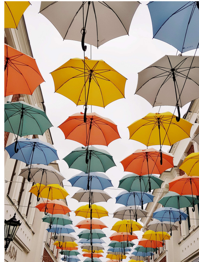
Illustrasjon: Paraplyer i ulike farger henger i luften i en gate.