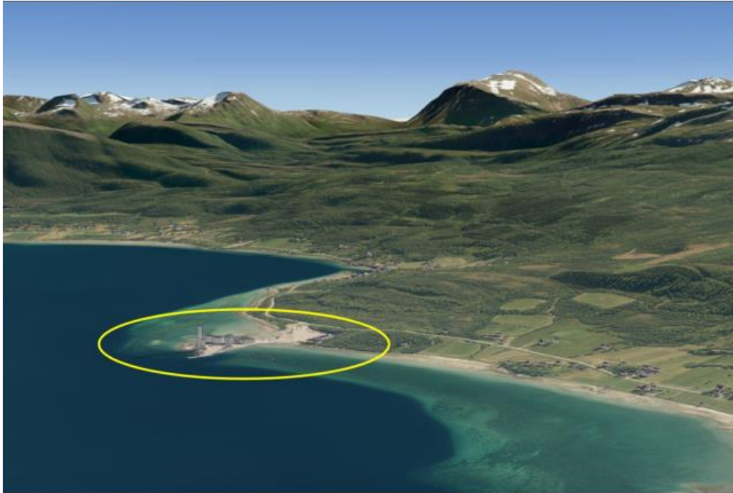
Figur 4-3. Skjærmarka og Tovikskjæret ligger i et småkupert kystslettelandskap (Nordlandsatlas).