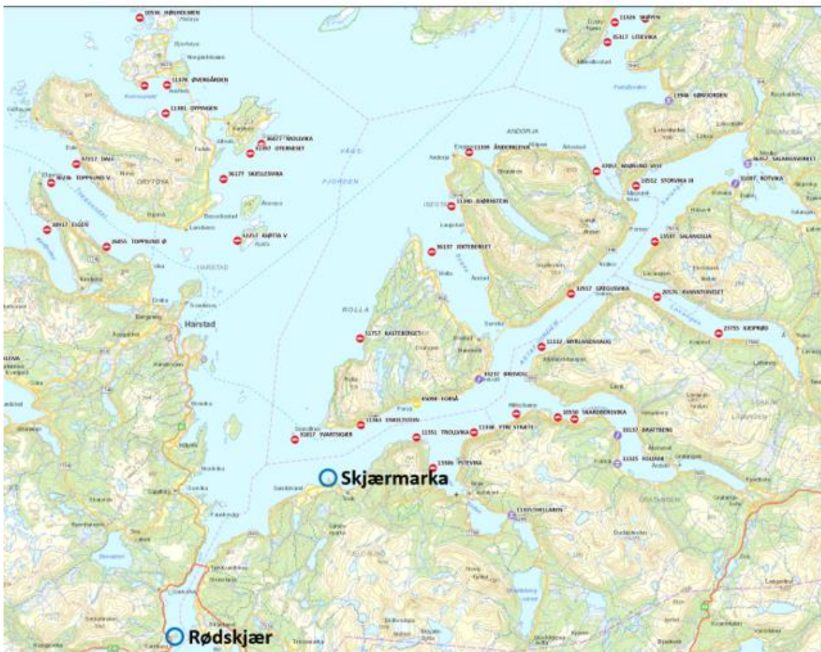
Figur 7-13. Skjærmarka og Rødskjær sammenholdt med akvakulturlokaliteter i nord og øst (Fiskeridirektoratet)