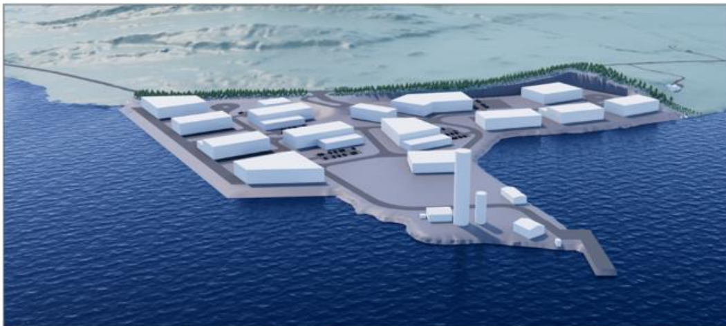
Figur 1-1. Visualisering. Eksisterende og mulig framtidig bebyggelse i planområdet (Norconsult).

Detaljreguleringen er i henhold til overordnede planer, kommunedelplan for Tovik vedtatt i 2008 og Kystplan II vedtatt i 2019, men ikke tidligere konsekvensutredet. Planlagte tiltak er vurdert i henhold til forskrift om konsekvensutredninger, gjeldende fra 01.07.2017. Tiltaket utløser krav om konsekvensutredning etter: