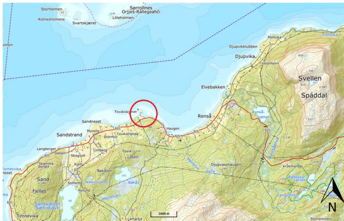
Figur 1. Oversiktskart av Tovikskjeret, Tovik, Skånland kommune lokalisert med rød sirkel.

Det undersøkte området ligger på østsiden av Tovikskjeret vest for Tovik i Skånland kommune, se oversiktskart Figur 1 og ortofoto Figur 2 . Tovikskjer-området benyttes i dag til lagring/distribusjon av Lecastein. Det har tidligere vært produksjon av Lecastein på området. Det er fylt ut i sjø i området på 1970-tallet.