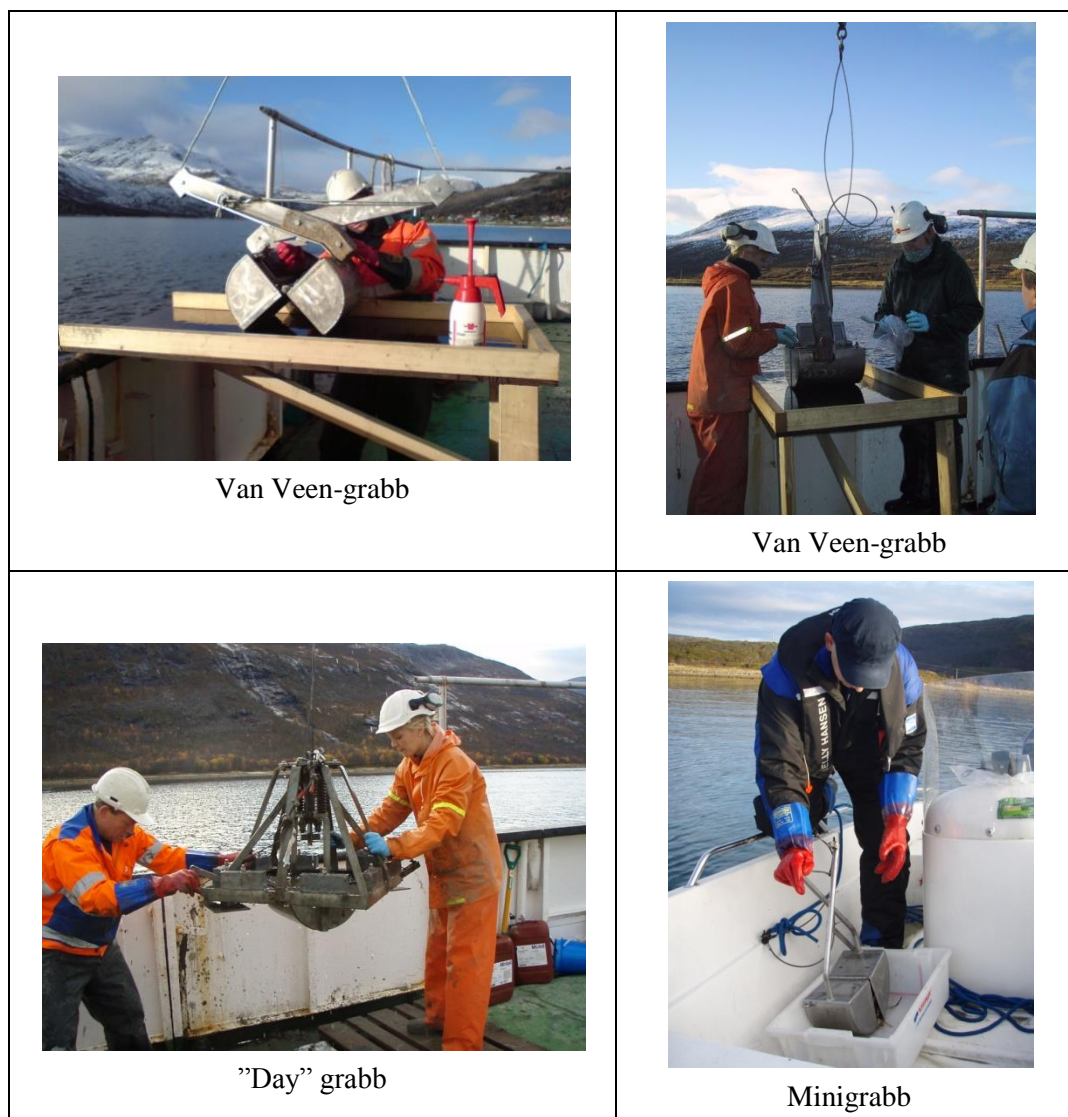
Figur 2 Standard van Veen-grabb med «inspeksjonsluker» hvor prøver blir tatt ut, «day» grabb på stativ og håndholdt minigrabb.

Multiconsult har flere standard van Veen-grabber og minigrabber i tillegg til en større grabb på stativ («day» grabb). Prøveinnsamling kan utføres med en av disse grabbene, avhengig av bunnforhold og tilgjengelighet for prosjektet. Grabbene er vist i figur 2.