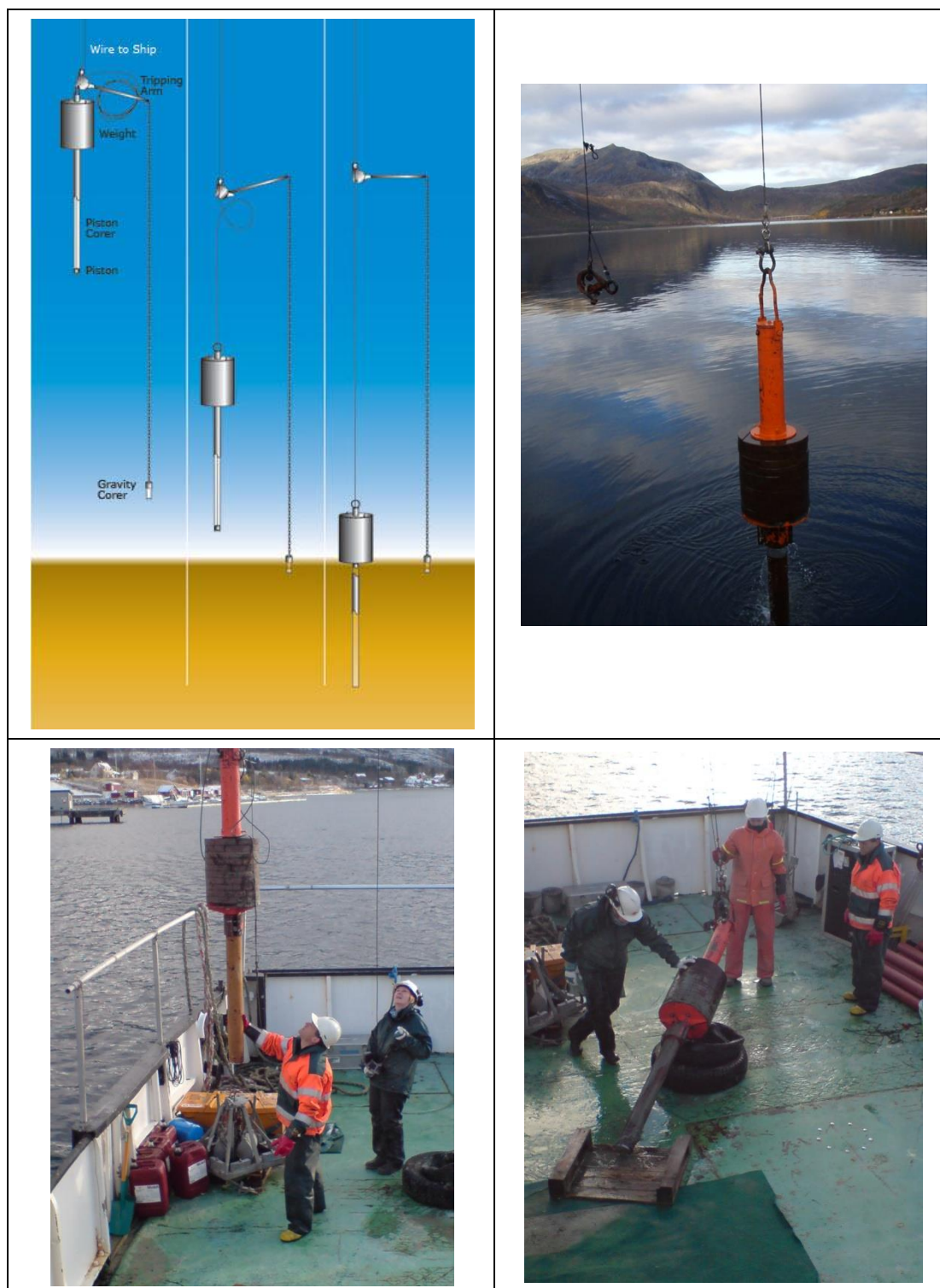
Figur 3 Prinsippskisse for prøvetaking med «pistoncorer», samt Multiconsults «pistoncorer» i bruk.

Kjerneprøven blir kvalitetsvurdert av miljøgeolog som bestemmer om prøven er godkjent eller underkjent. Ved for eksempel manglende fylling i sylindere, tydelige spor av utvasking av prøven, mistanke om at overflaten av prøven er forstyrret eller annet, blir prøven forkastet og ny prøve tas.