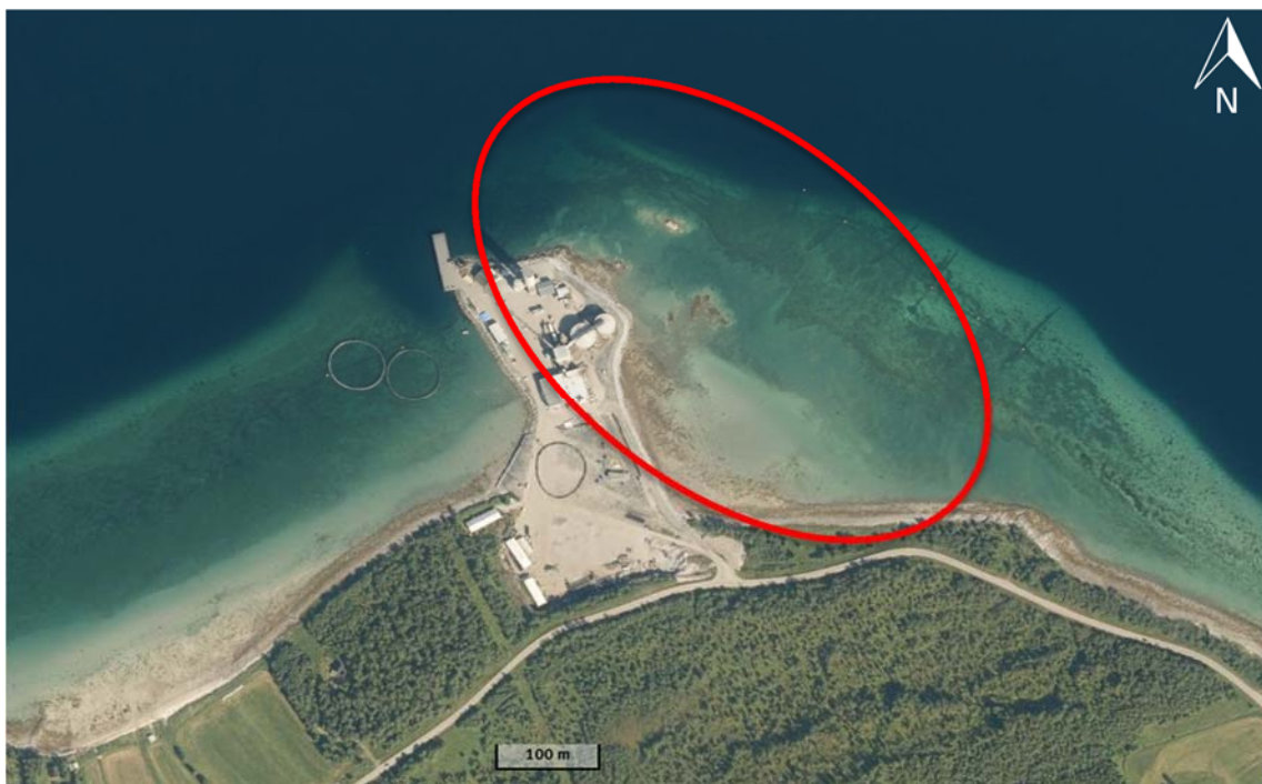
Figur 2. Ortofoto over det aktuelle området på Tovikskjeret, utfyllingen planlegges innenfor området markert med rød ring.