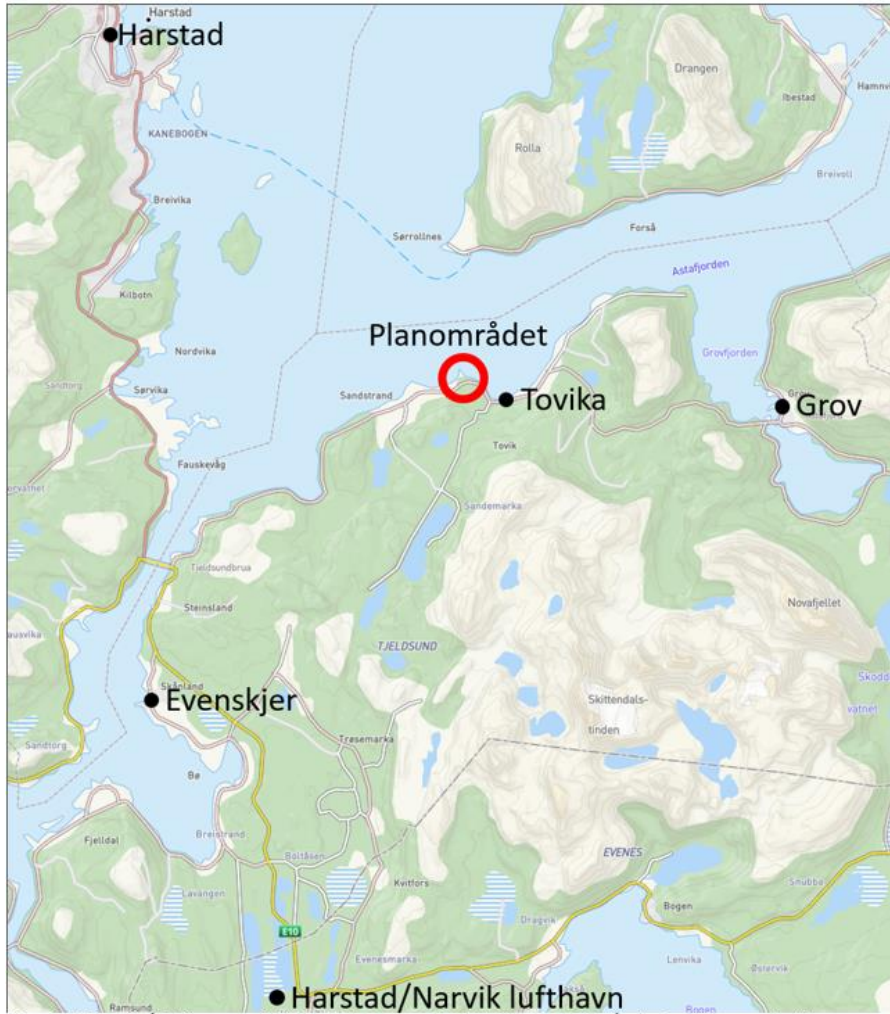
Figur 2.4 Planområdet ligger nord i Tjeldsund kommune, der Astafjorden møter Vågsfjorden (Kommunekart)

Fv. 825 ligger like forbi planområdet, med adkomst både fra sørvest og nordøst. Sjøveien er adkomsten til planområdet via Vågsfjorden i nord, Astafjorden i nordøst eller Tjeldsundet i sørvest.