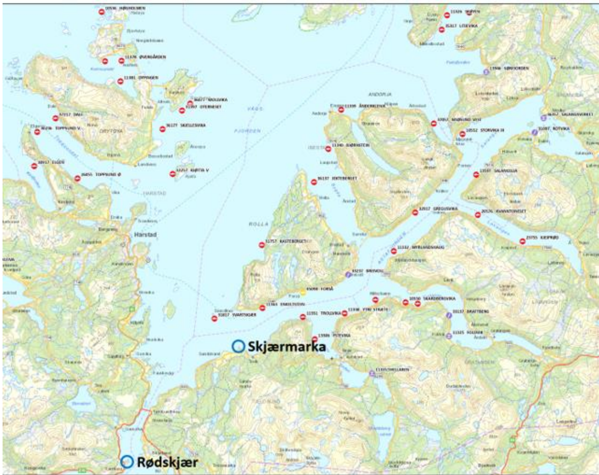
Figur 7-13. Skjærmarka og Rødskjær sammenholdt med akvakulturiokaliteter i nord og øst (Fiskeridirektoratet)